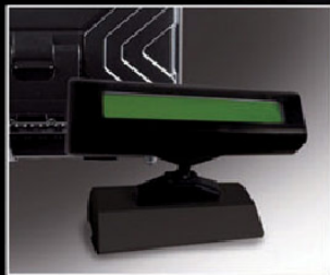
Visor posterior opcional regulable en altura