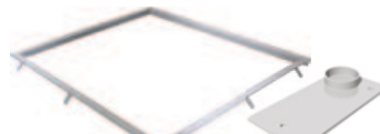
Marco para empotrar con Placas de anclaje (4 unidades)