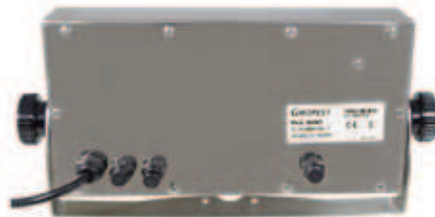
Alimentación a red 230 VAC.