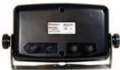
Cargador de batería AC/DC 100-240 Vac 50-60 Hz.