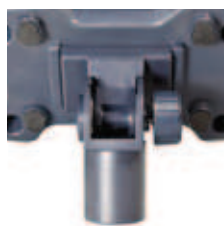
Codo adaptador para columna