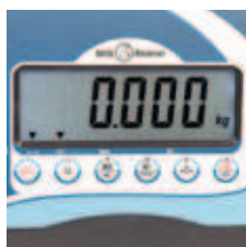
Display LCD de 30 mm