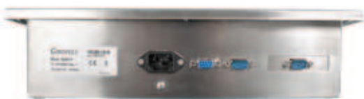
Alimentación a red 230 VAC.