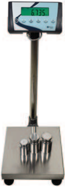
Codo adaptador para columna