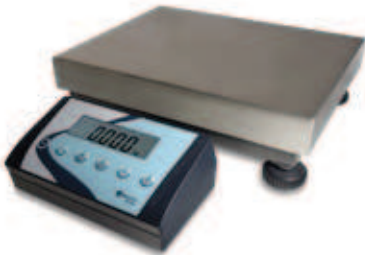
Adaptador soporte bajo