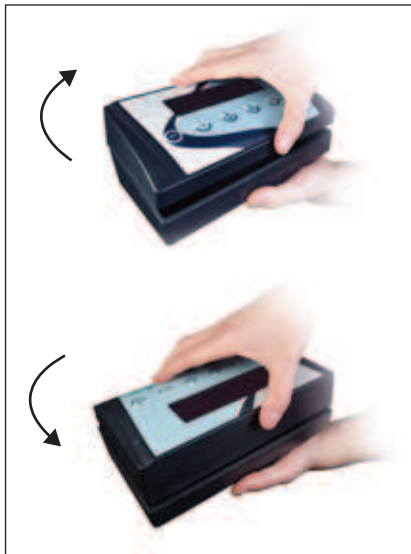
Flip-Flop 180° (Caja reversible)